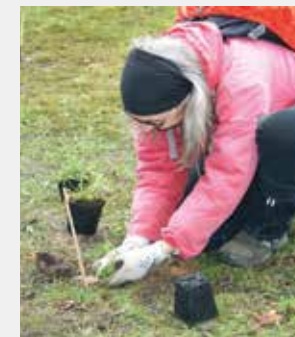
Mit Spaß und Fleiß bei der Arbeit!