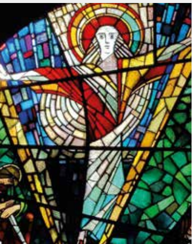
Das Christusfenster der Auferstehungskirche in Lurup