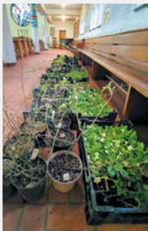
Pflanzen in der Kirche vor dem Pflanzen