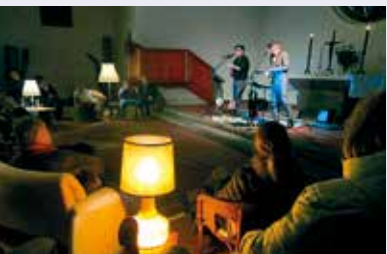
Sofakonzert mit "Ukes of tomorrow"