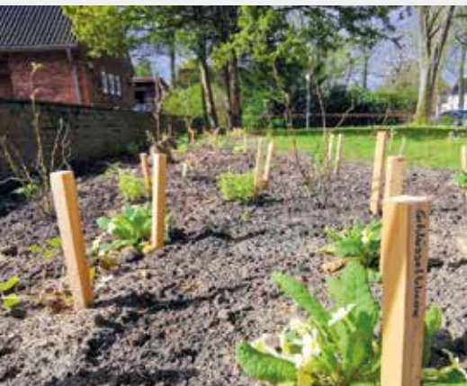
Frisch gesetzte Schlüsselblumen